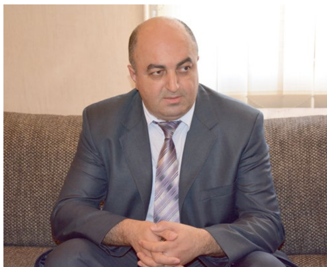
საქართველოს სახალხო დამცველი ურა ნანუაშვილი

დაინყო ახალი – 2016 წელი, ახალი იმედების, ახალი გეგმებისა და გამოწვევების წელიწადი. დღეს, ამ მისალმების წერისას, თვალი გადავაკვლიე სახალხო დამცველის აპარატის გასული წლის საქმიანობას და შევეცადე, განსაკუთრებით საინტერესო და მნიშვნელოვანი მომენტები შემეჩინა იმ უამრავ საქმეთა შორის, რაც ჩვენმა გუნდმა განახორციელა. მართალია, რამდენიმეს ცალკე გამოყოფა ძნელი აღმოჩნდა, მაგრამ ვფიქრობ, რომ ადამიანის უფლებათა აკადემიის გახსნა და ცხელი ხაზის ამოქმედება განსაკუთრებულ აღნიშვნას იმსახურებს. მნიშვნელოვან მოვლენათა შორის შემიძლია გამოყოფა ადამიანის უფლებათა დაცვის ეროვნული ინსტიტუტების ევროპული ქსელის გენერალურ ასამბლეაზე საქართველოს სახალხო დამცველის ადამიანის უფლებათა ეროვნული ინსტიტუტების საერთაშორისო საკოორდინაციო კომიტეტის ბიუროს სრულუფლებიან წევრად არჩევა; ასევე, პატიმრობის კოდექსში განხორციელებული ცვლილება, რომლის თანახმად,